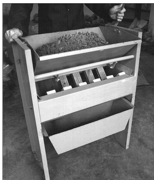
Fig. 2.2 : Échantillonneur pour graviers